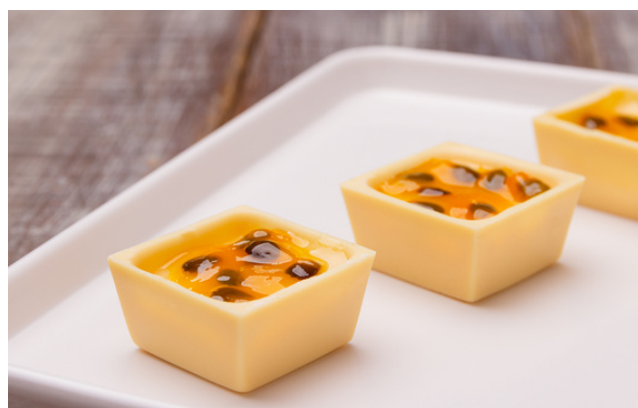
QUADRADINHO DE CHOCOLATE BRANCO RECHEADO COM MOUSSE DE MARACUJÁ OU DE LIMÃO R$5,40 CADA