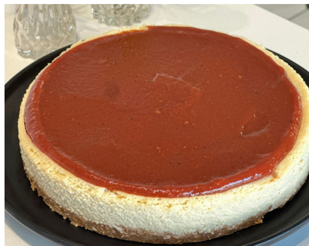
CHEESECAKE DE GOIABADA OU FRUTAS VERMELHAS