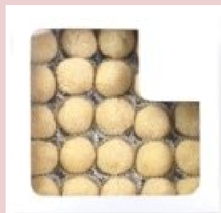
brigadeiro com damasco