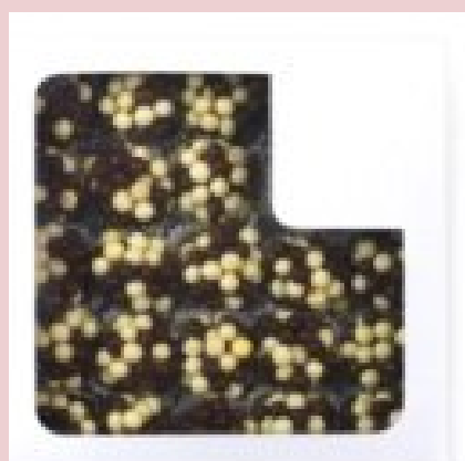
brigadeiro com bolinhas