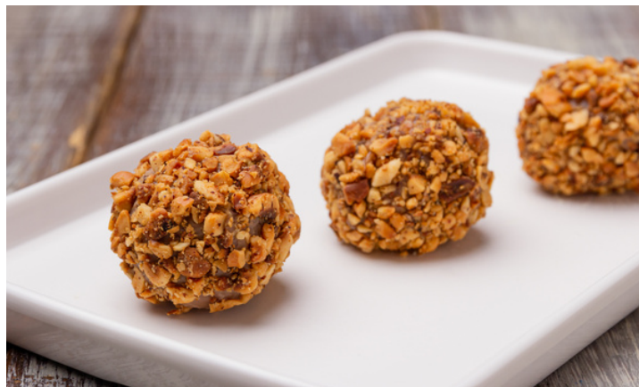
BRIGADEIRO DE NUTELLA E AVELÃS