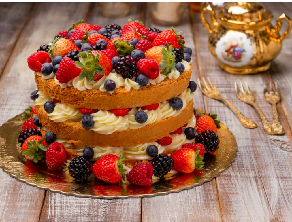
NAKED CAKE DE FRUTAS VERMELHAS