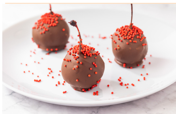
BOMBOM DE CEREJA R$4,90 CADA