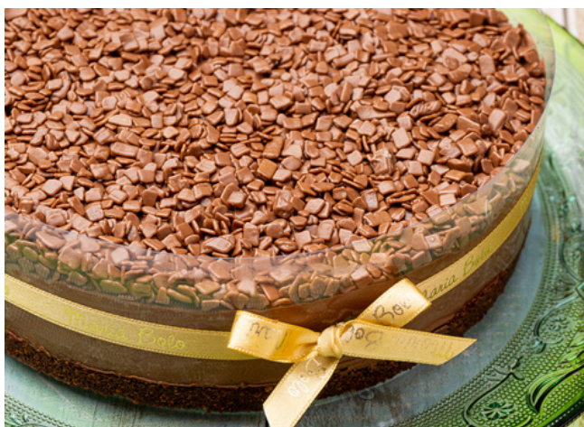
TORTA MOUSSE DE CHOCOLATE