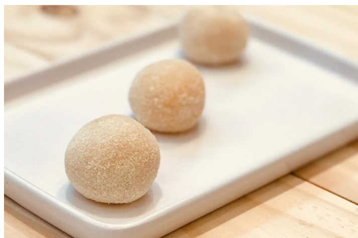
BRIGADEIRO DE LEITE NINHO