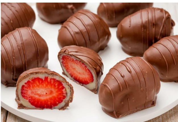
BOMBOM DE MORANGO R$11 CADA ACIMA DE 30 UNIDADES R$10,00 CADA