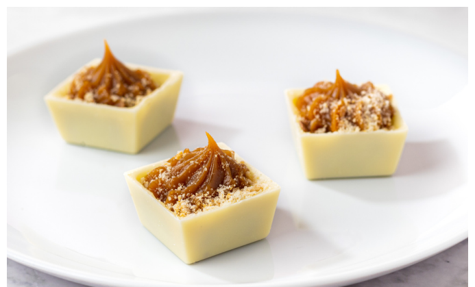
QUADRADINHO DE CHOCOLATE BRANCO COM DOCE DE LEITE E PAÇOCA R$5,40 CADA