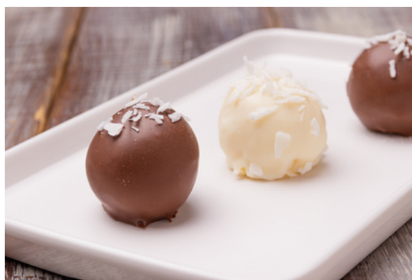
BOMBOM DE COCO COM CHOCOLATE BRANCO OU AO LEITE R$4,20 CADA