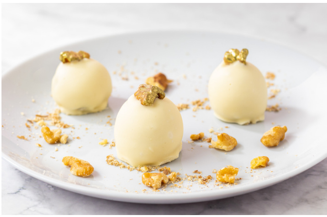
CAMAFEU DE NOZES R$4,90 CADA