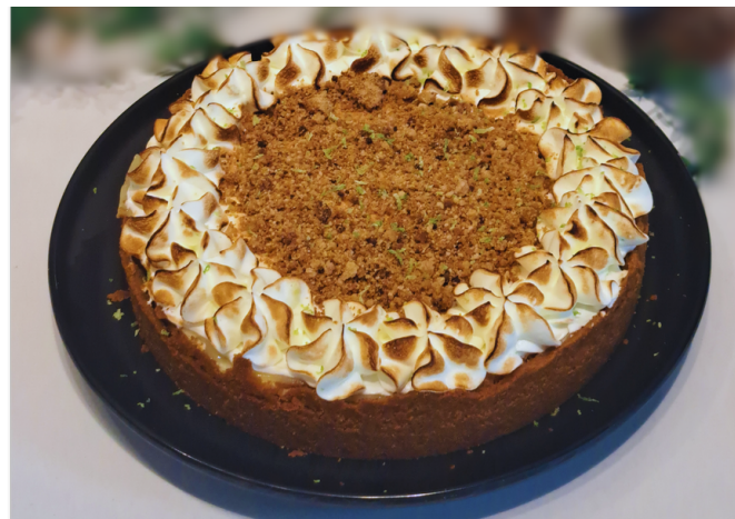
TORTA DE LIMÃO