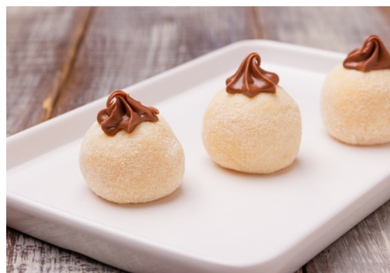
DOCINHO DE LEITE NINHO COM NUTELLA R$4,40 CADA