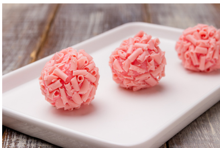
MORANGUINHO ESPECIAL COM GRANULADO CALLEBAUT