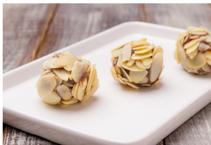
BRIGADEIRO COM LASCAS DE AMÊNDOA