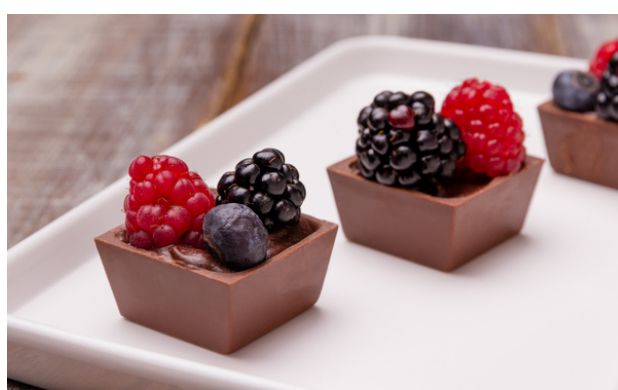
QUADRADINHO DE CHOCOLATE BRANCO RECHEADO COM GANACHE DE CHOCOLATE E FRUTAS R$9,00 CADA