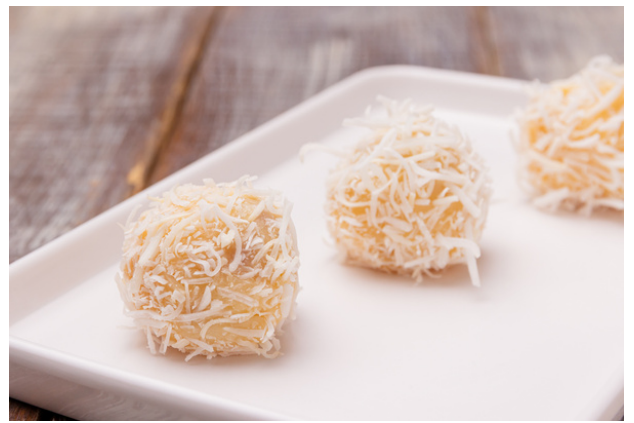
BEIJINHO DE COCO E GOIABADA R$4,40 CADA