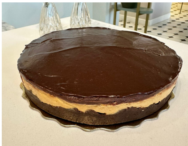
DUETO DOCE-DE-LEITE E CHOCOLATE