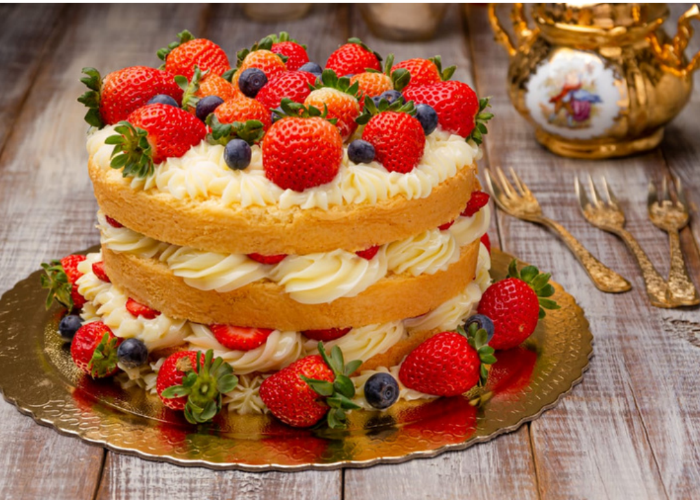
NAKED CAKE DE MORANGOS