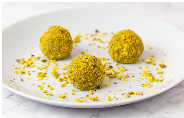
BRIGADEIRO DE PISTACHE R$6,00 CADA