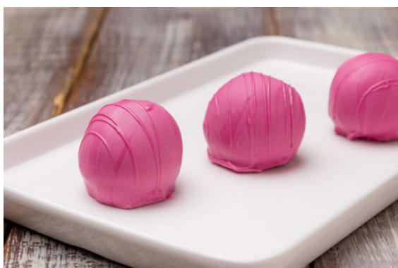
TRUFA DE FRAMBOESA R$4,90 CADA