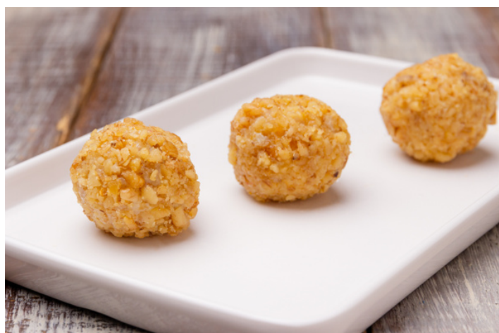
BRIGADEIRO DE NOZES