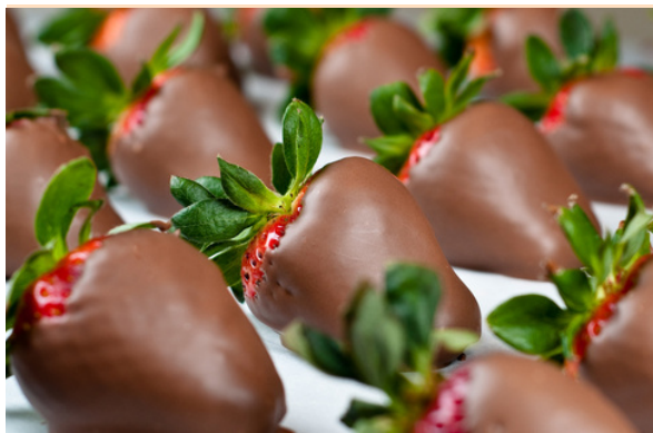
MORANGO BANHADO NO CHOCOLATE R$4,20 CADA