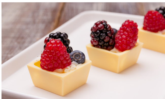
QUADRADINHO DE CHOCOLATE BRANCO RECHEADO COM BRIGADEIRO BRANCO E FRUTAS R$9,00 CADA