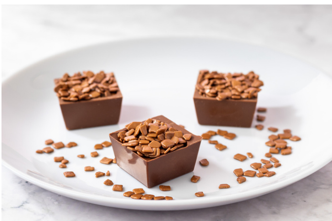
QUADRADINHO DE CHOCOLATE COM BRIGADEIRO BELGA R$5,40 CADA