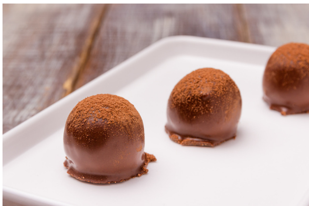
TRUFA DE CHOCOLATE R$4,90 CADA SE FOR DOURADA R$5,40 CADA