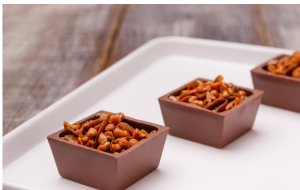
QUADRADINHO DE CHOCOLATE RECHEADO COM GANACHE DE CHOCOLATE AO LEITE E CROCANTE R$5,40 CADA