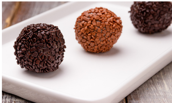
BRIGADEIRO AO LEITE E MEIO AMARGO COM GRANULADO CALLEBAUT