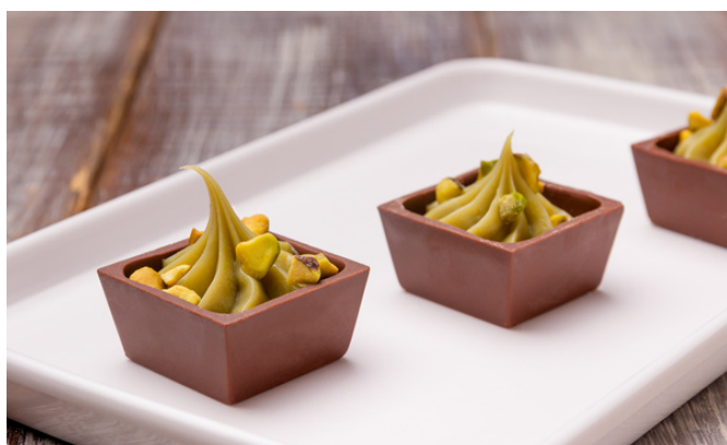
QUADRADINHO DE CHOCOLATE AO LEITE RECHEADO COM CREME DE PISTACHE R$5,20 CADA