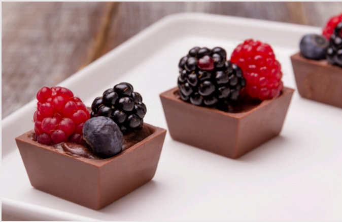
QUADRADINHO DE CHOCOLATE RECHEADO COM GANACHE DE CHOCOLATE E FRUTAS VERMELHAS R$13 CADA MÍNIMO 20 UNIDADES