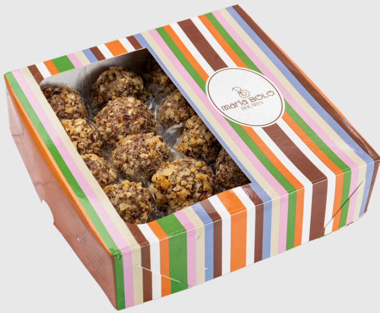
BRIGADEIRO DE NUTELLA E AVELÃS