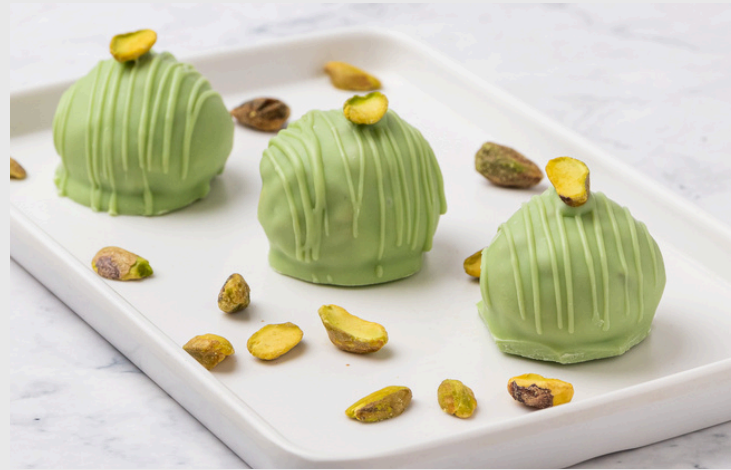
BRIGADEIRO DE PISTACHE