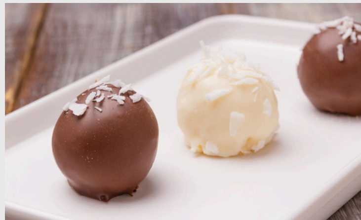
BEIJINHO C/ CHOCOLATE BRANCO OU AO LEITE