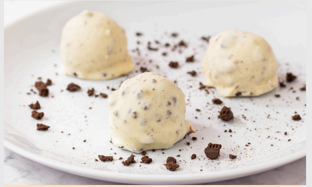
BRIGADEIRO DE CHOCOLATE COM OREO