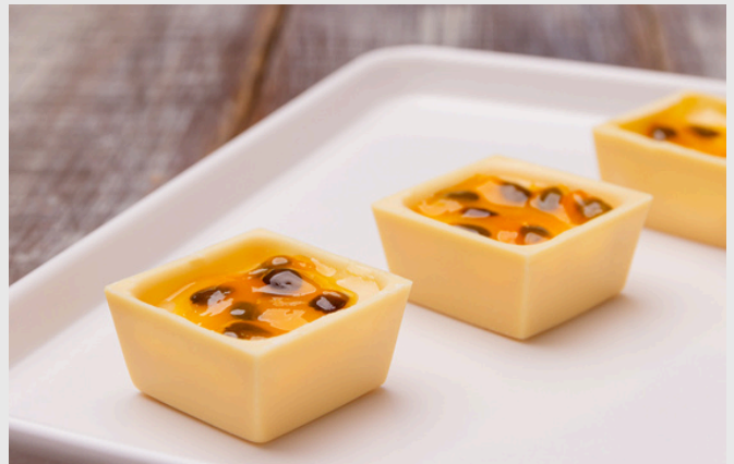
QUADRADINHO DE CHOCOLATE BRANCO COM MOUSSE DE MARACUJÁ OU DE LIMÃO