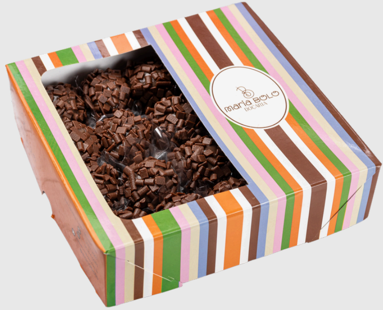
BRIGADEIRO MEIO AMARGO