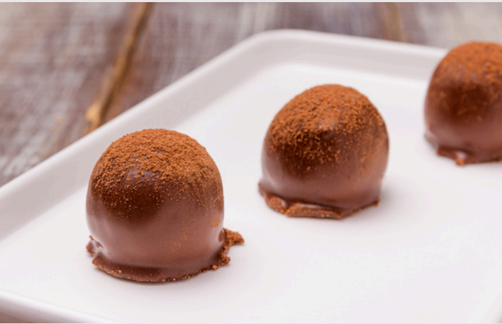
TRUFAS DE CHOCOLATE

CAIXA COM 20 UNIDADES DO MESMO SABOR R$129