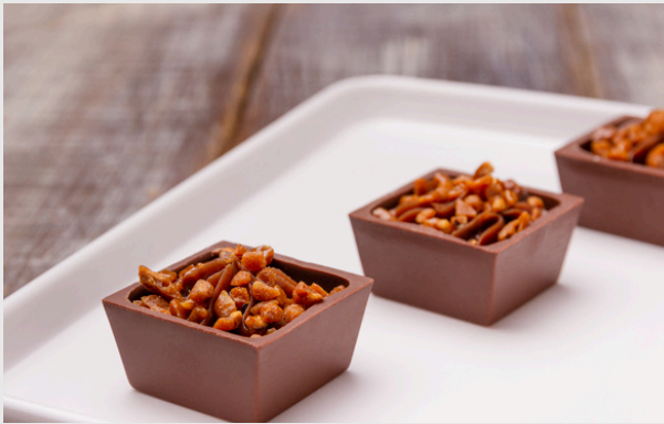
QUADRADINHO DE CHOCOLATE COM GANACHE DE CHOCOLATE AO LEITE E CROCANTE OU GRANULADO