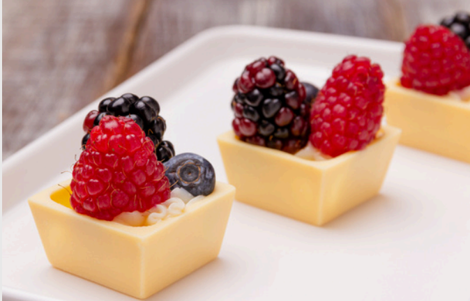
QUADRADINHO DE CHOCOLATE BRANCO RECHEADO COM BRIGADEIRO BRANCO E FRUTAS VERMELHAS R$13 CADA MÍNIMO 20 UNIDADES