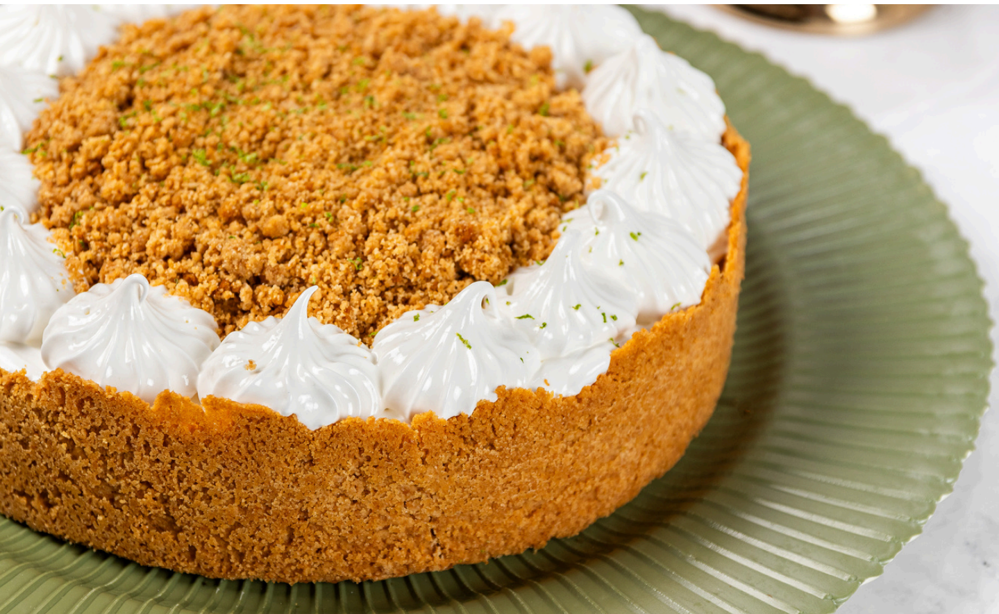
CHEESECAKE DE GOIABADA OU FRUTAS VERMELHAS