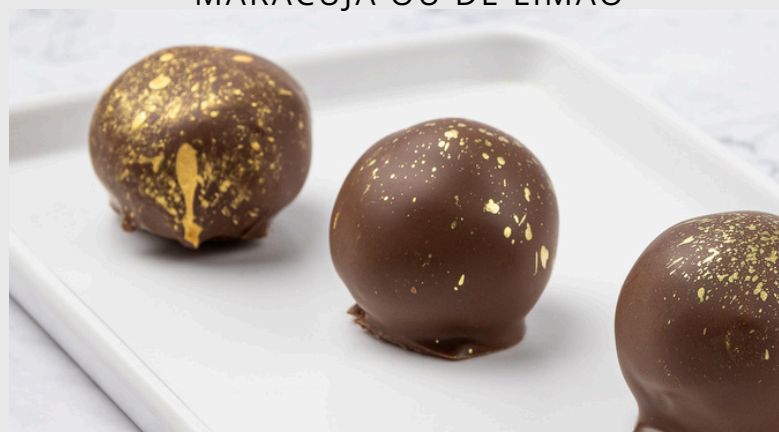
TRUFA DE PÃO DE MEL