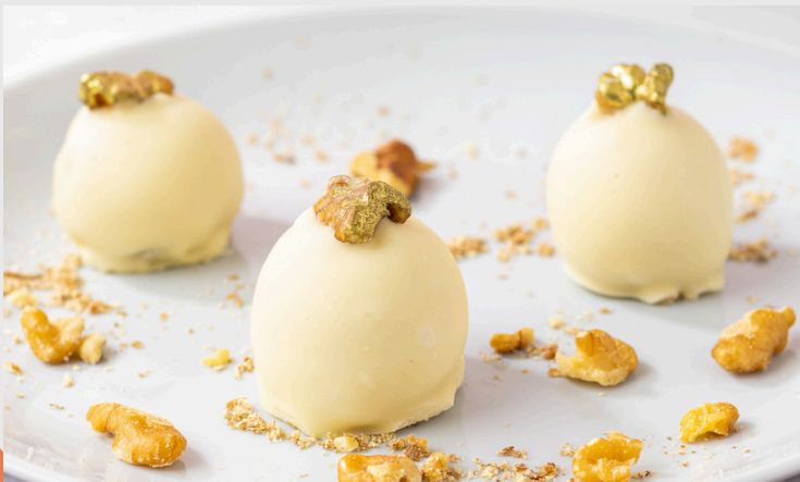
CAMAFEU DE NOZES