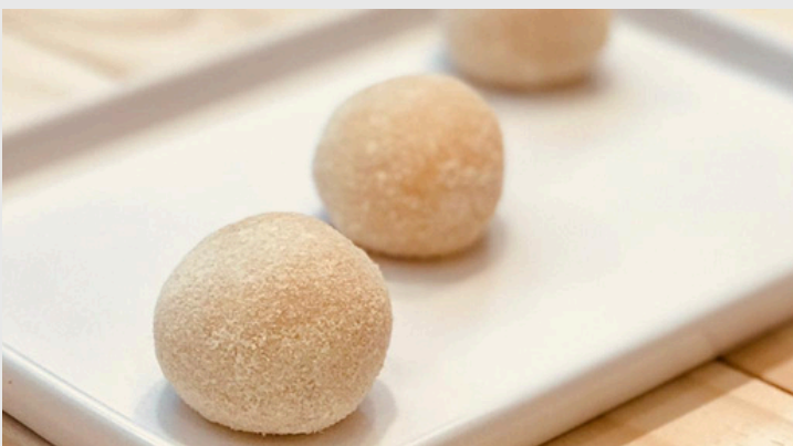
BRIGADEIRO BRANCO COM UVA