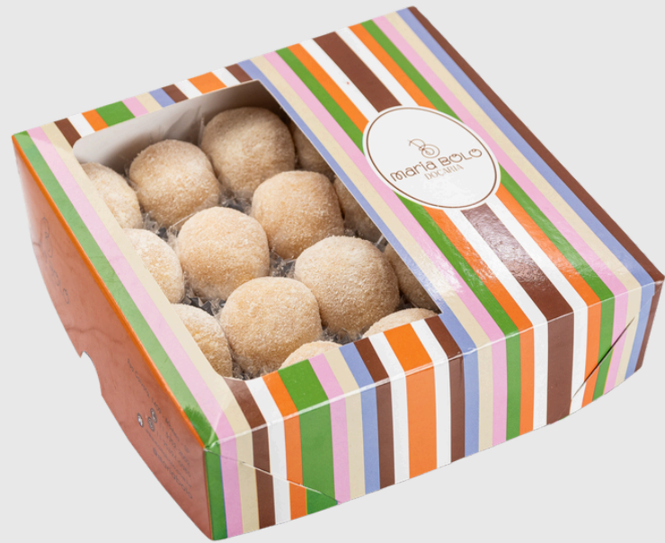
BRIGADEIRO DE LEITE NINHO