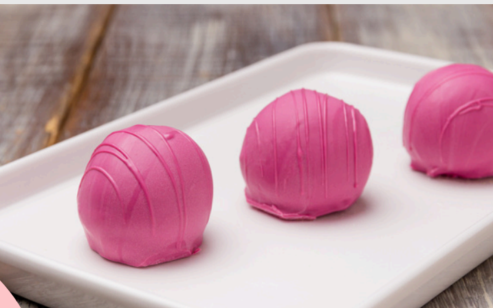
TRUFA DE FRAMBOESA