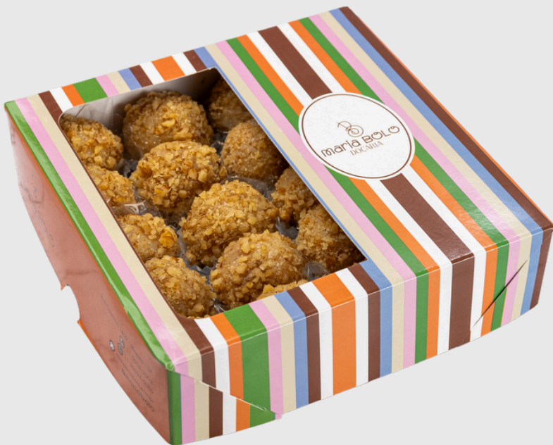
BRIGADEIRO DE NOZES