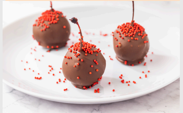
BOMBOM DE CEREJA