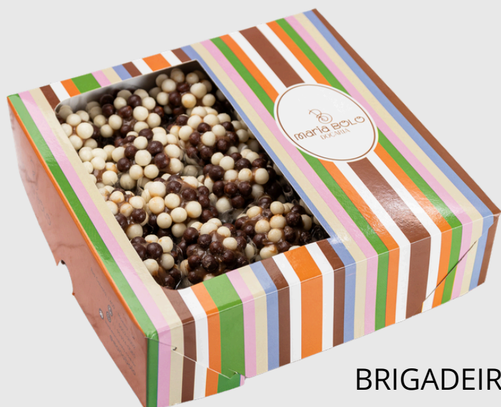
BRIGADEIRO COM BOLINHAS