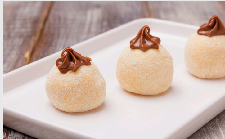
LEITE NINHO COM NUTELLA