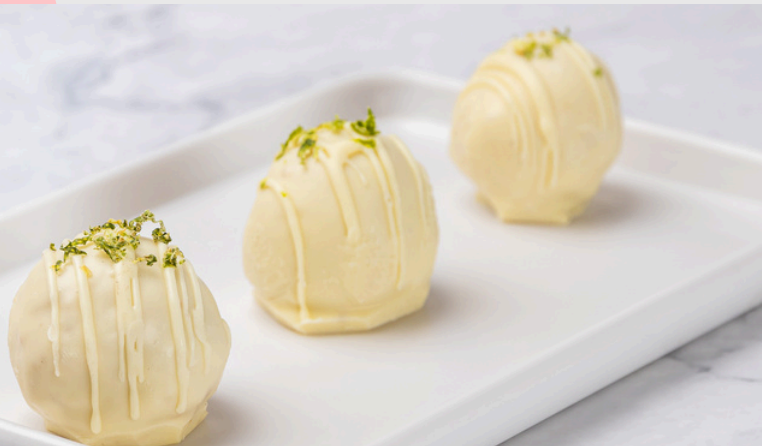
TRUFA DE LIMÃO C/CHOCOLATE BRANCO